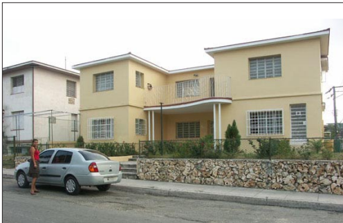
Lorena vive en el segundo piso

2. De blev kompisar med Lorena och brukar sitta i vardagsrummet och tittar på TV och dircker kaffe hela natten så att det finns ingen risk att någon tränger sig in i huset utan att bli märkt.